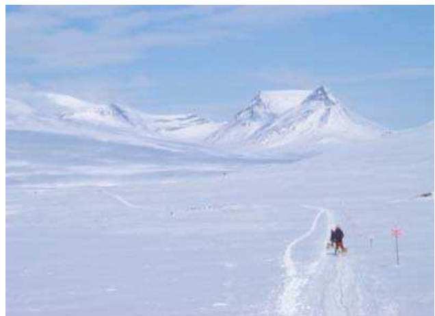
Panorama typique du Mountain Tour.