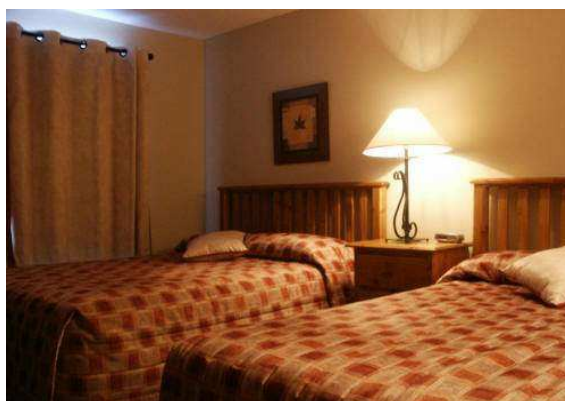
Schlafzimmer 2 Queen Betten