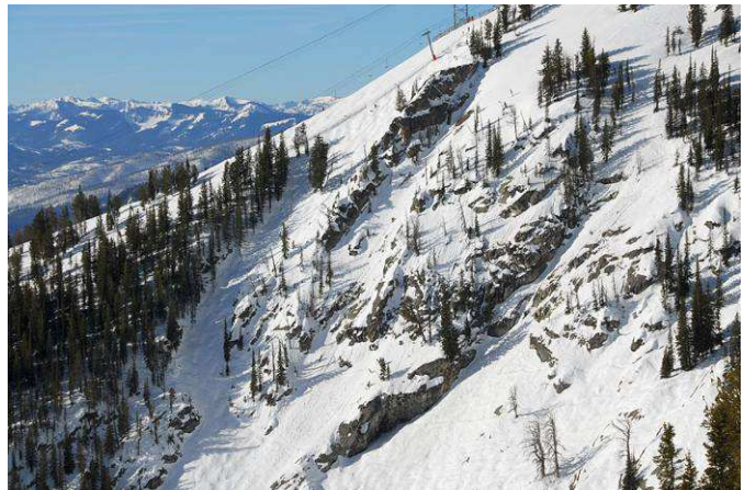
Alpenhof Lodge ****, Teton Village