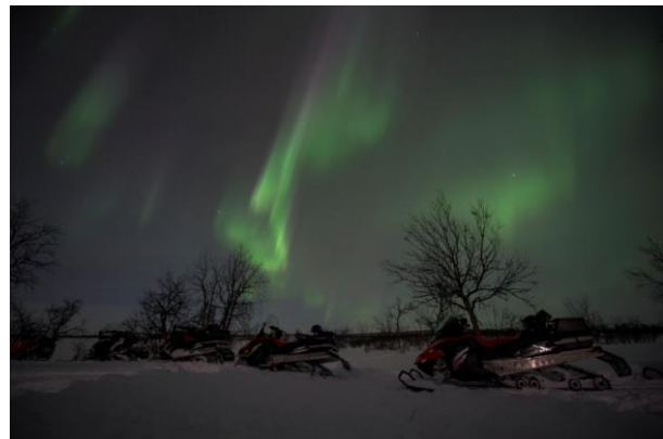
Activités motoneige avec traque d'aurores boréales