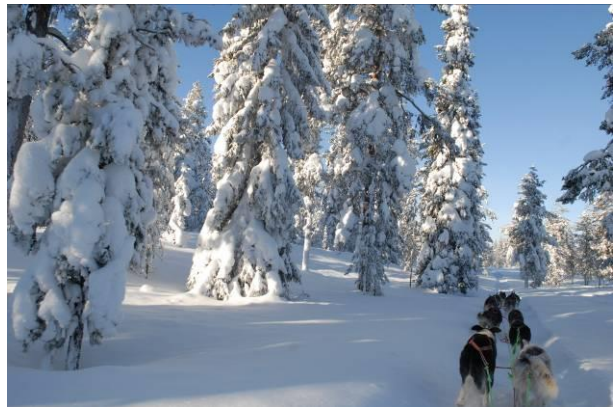
Activités motoneige et traîneau à chiens