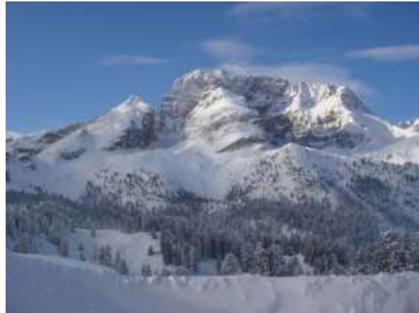
Hôtel Hohe Gaisl avec le mont Gaisl