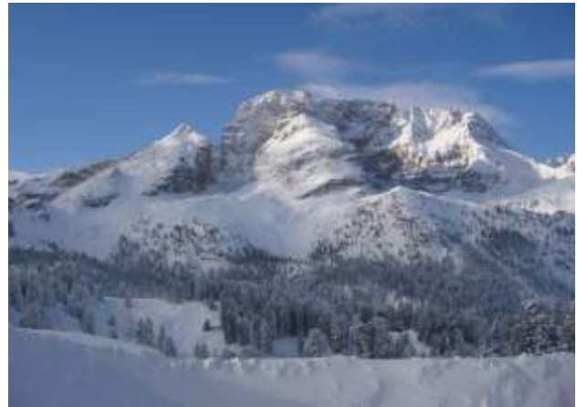
Hôtel Hohe Gaisl avec le mont Gaisl