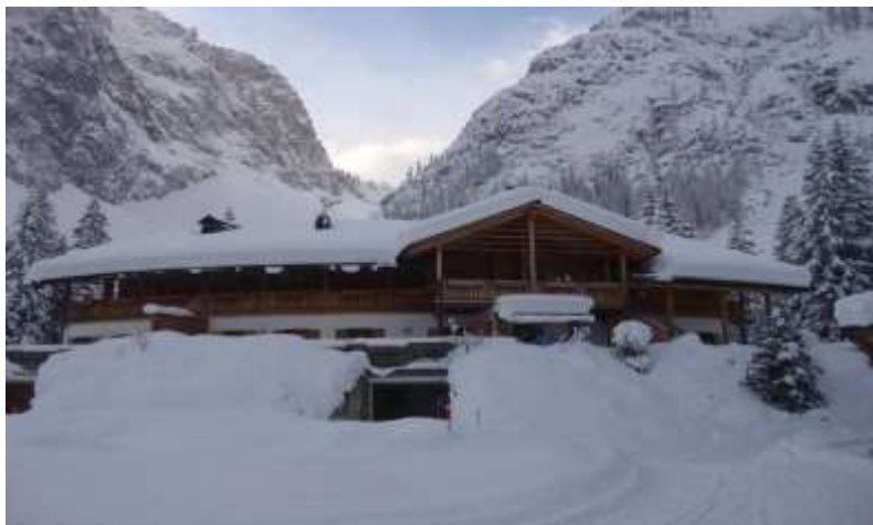
Le superbe restaurant « Talschlusshütte » au cœur des Dolomites

Petit déjeuner dans votre hôtel puis départ de votre seconde étape avec un court transfert d'une dizaine de minute en navette. La boucle en direction du col de Kreuzberg se nomme « piste panoramique » et est tout simplement mystique. Possibilité de vous restaurer dans un des restaurants (Nemesalm ou Coltrondo Alm) pour vous remettre d'aplomb. Seconde partie de votre étape dans l'après-midi en redescendant sur Sexten ou possibilité de rallonger l'étape en traversant de superbes forêts de mélèzes en direction de la vallée de Fischlein et là également restauration possible au restaurant Talschlusshütte. 3 ème nuit à Sexten.