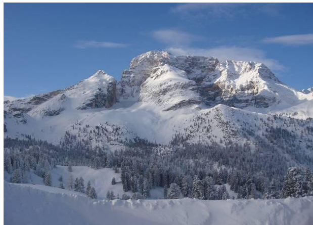
Hôtel Hohe Gaisl avec le mont Gaisl