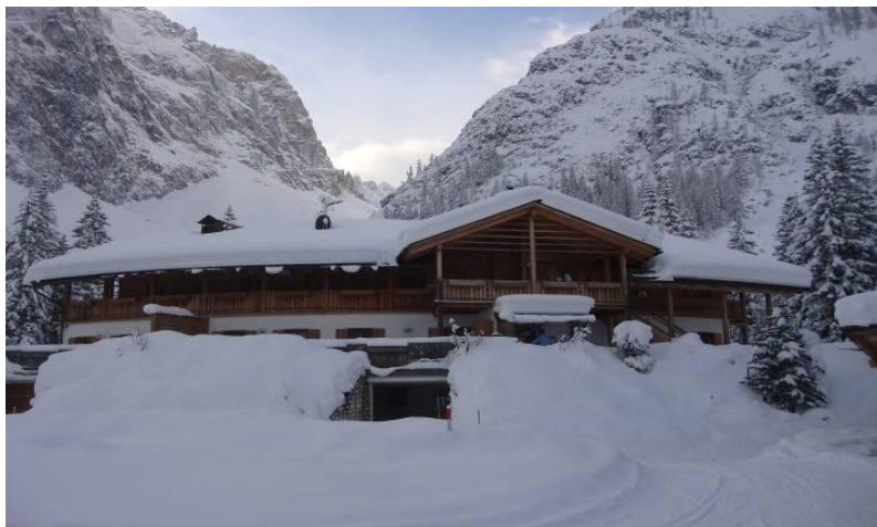
Le superbe restaurant « Talschlusshütte » au cœur des Dolomites

Petit déjeuner dans votre hôtel puis départ de votre seconde étape avec un court transfert d'une dizaine de minute en navette. La boucle en direction du col de Kreuzberg se nomme « piste panoramique » et est tout simplement mystique. Possibilité de vous restaurer dans un des restaurants (Nemesalm ou Coltrondo Alm) pour vous remettre d'aplomb. Seconde partie de votre étape dans l'après-midi en redescendant sur Sexten ou possibilité de rallonger l'étape en traversant de superbes forêts de mélèzes en direction de la vallée de Fischlein et là également restauration possible au restaurant Talschlusshütte. 3 ème nuit à Sexten.