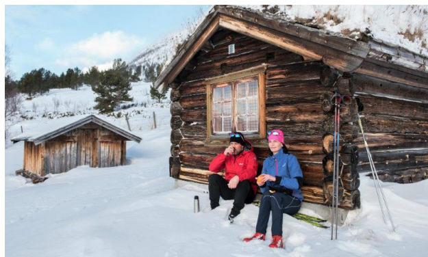
Eine Langlauf-Tour für Geniesser