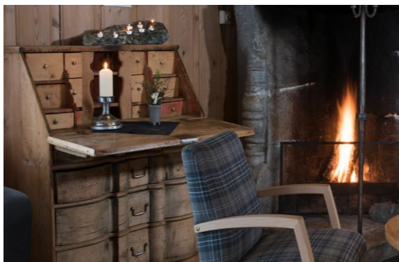
Gemütlichkeit in der Lemonsjøe Fjellstue

Internationaler Flug bis Oslo Gardermoen ab Ihrem gewünschten Flughafen. Weiterreise per Zug nach Otta ( Abfahrt des Zugs ab Oslo Flughafen um 14.29 Uhr ). Die Züge Richtung Norden fahren direkt am Flughafen Oslo ab, die Fahrt dauert etwa drei Stunden. Von hier werden Sie von Ihrer ersten Unterkunft abgeholt und bis zum Hotel nach Lemonsjøe gefahren, wo auch bereits das Abendessen auf Sie wartet. Bei der Ankunft im Hotel erhalten Sie auch alle Informationen und genauen Beschreibungen für Ihre Langlauftour sowie detailliertes Kartenmaterial. So sind Sie top gerüstet für Ihr Norwegen-Abenteuer.