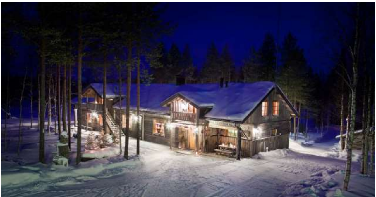
La superbe chambre d'hôte d'Isokenkäisten

Petit déjeuner à Rukan Salonki avant de poursuivre votre périple aujourd'hui en direction de l'est. La pause de midi se fera dans le superbe village traditionnel de pêcheurs Ollila. Il va sans dire que ce repas de midi sera à base de poisson frais ! Il y a beaucoup de pêcheurs vivant de leur passion dans ce village même en hiver. Seconde partie de journée avec la Carélie russe à portée de vue depuis le mont Kuntivaara avant de redescendre après une centaine de kilomètres pour cette journée jusqu'à la chambre d'hôte d'Isokenkäisten pour la nuit. Sauna et dîner au restaurant.