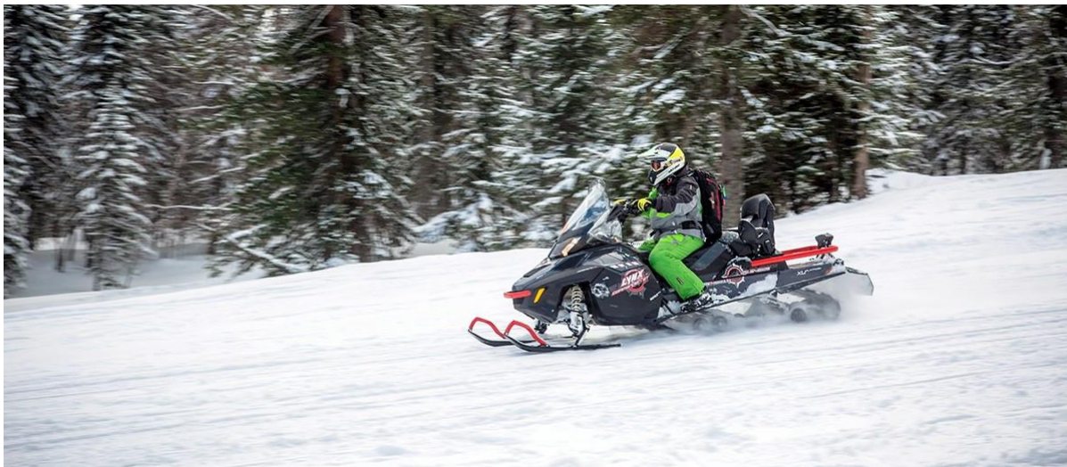
Lynx 900 ACE en duo, une machine puissante et confortable, adaptée aux grands espaces et tous types de terrain.

Vous pilotez soit une LYNX 900 ACE ou YETI 600 ACE ou équivalent équipé d'un porte bagage et d'un top case.