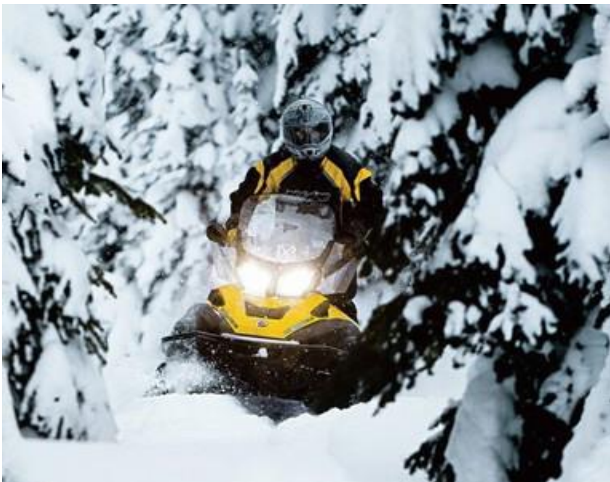
LYNX SCANDIC ou YETI 600 ACE en solo, le «passe partout» prisé des professionnels évoluant en terrain difficile.