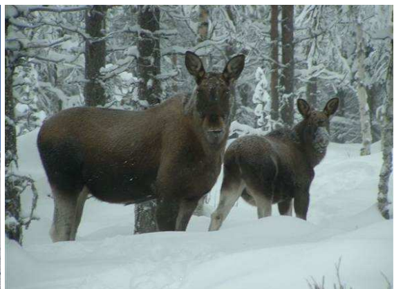
Norwegen – das Land des Langlaufens