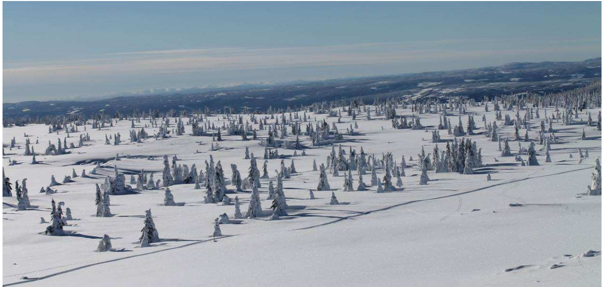
Das Hochplateau bei Nordseter