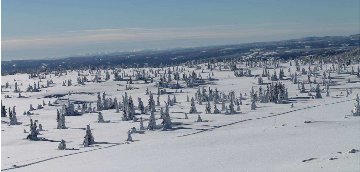
Das Hochplateau bei Nordseter