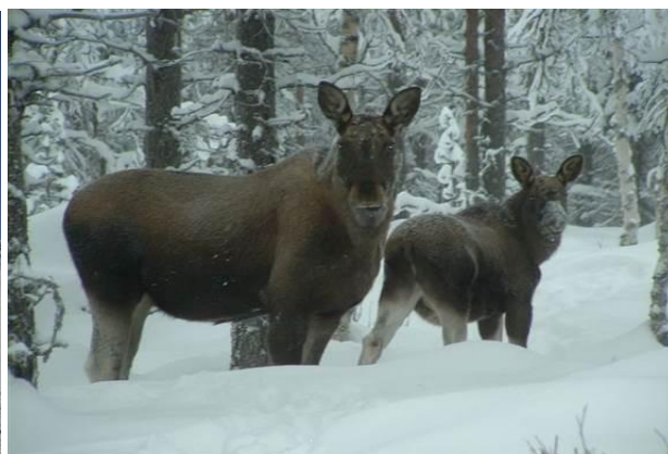
Norvegia – il paese dello sci di fondo