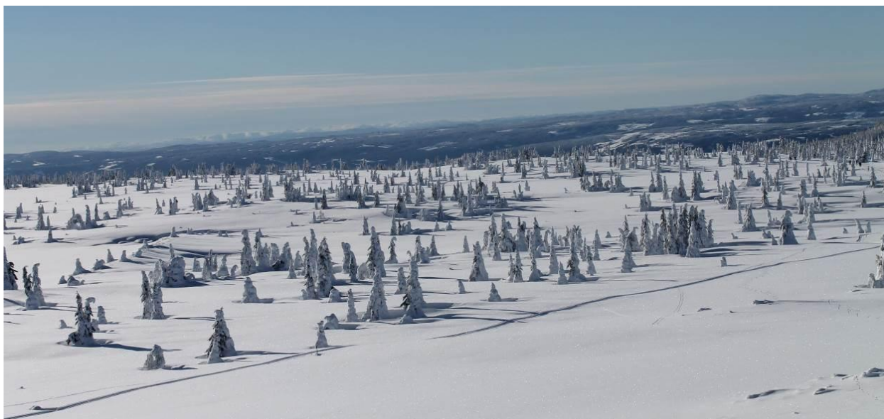
Lillehammerfjellet presso Nordseter