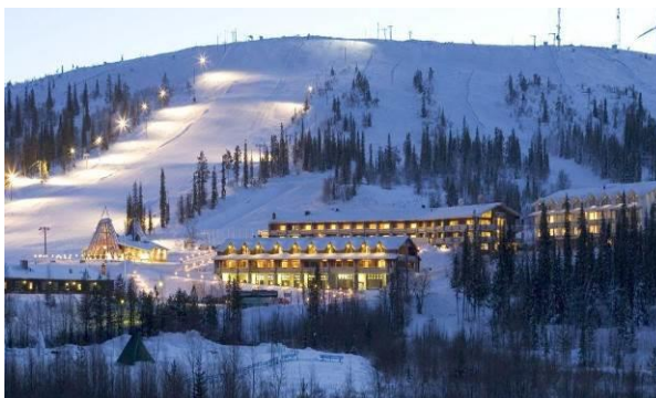
Vue d'ensemble de l'hôtel