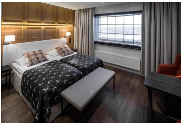
Chambre double standard