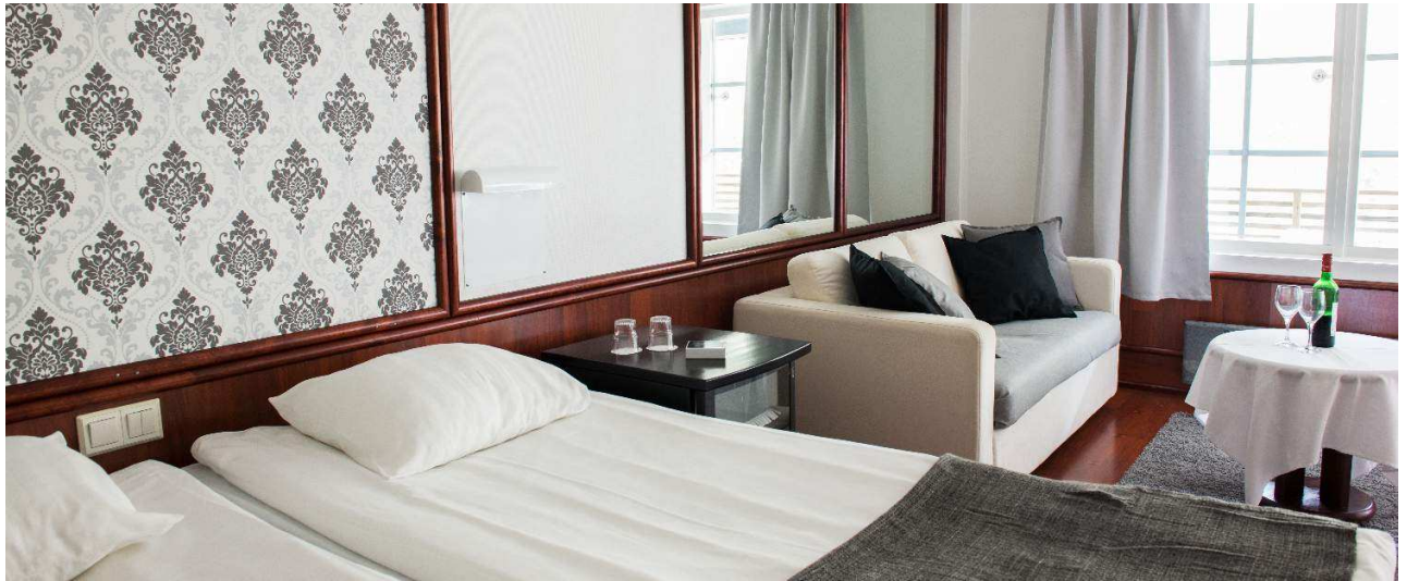
Superiorzimmer mit Sitzecke