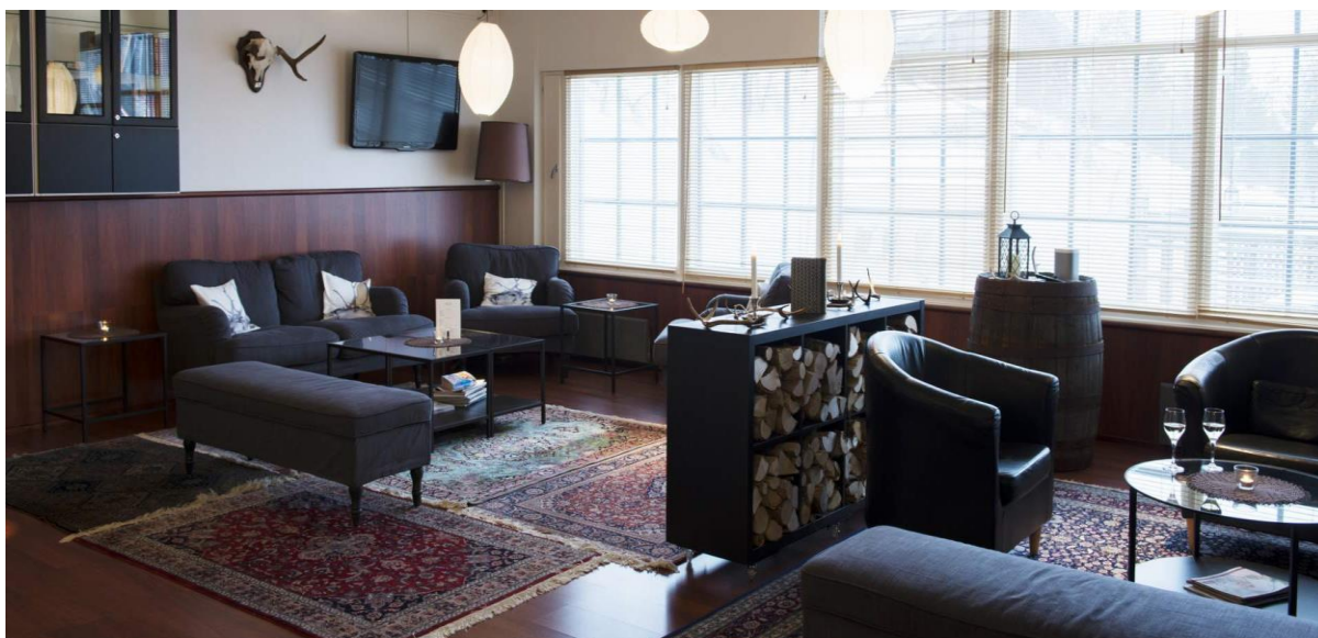
La lounge de l'hôtel Royal Ruka

L'hôtel Royal Ruka est admirablement situé avec la vue sur le mont Ruka qui lui domine le village et le parc naturel de Valtavaara. Les pistes de ski de fond démarrent tout en douceur juste devant votre hôtel alors qu'il vous faudra 15 minutes à pied pour rejoindre le village ou alors avec le bus local qui lui démarre sur la route principale situé en contre-bas de l'établissement. Le petit hôtel boutique possède 15 chambres doubles décorées avec goût, un restaurant où sont servis les repas, une terrasse panoramique avec vue sur le mont local de même qu'un sauna.