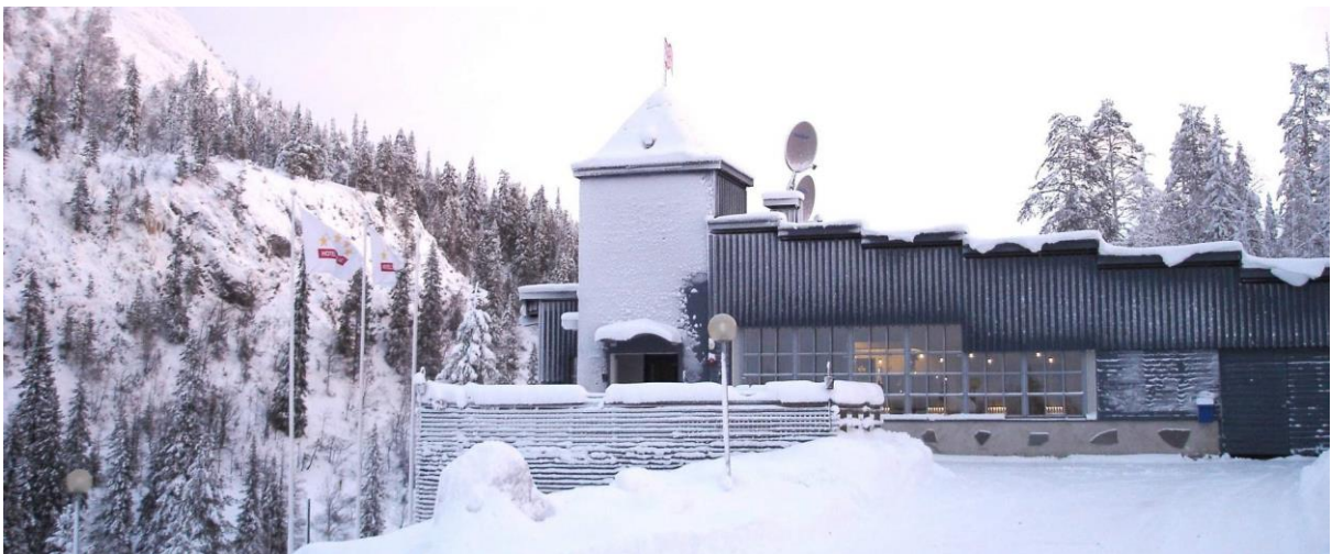
Vue extérieure de l'hôtel Royal Ruka

Le réseau des pistes comportant 200 kilomètres, tracés dans les deux styles, propose des parcours pour tous les goûts, jalonnés comme il se doit de petits kotas (sortes de petits cafés) et ici et là de petits restaurants. Le sauna avec sa piscine « découpée » dans la glace du lac vous attend en fin d'après-midi avant un excellent repas servi avec des spécialités locales.