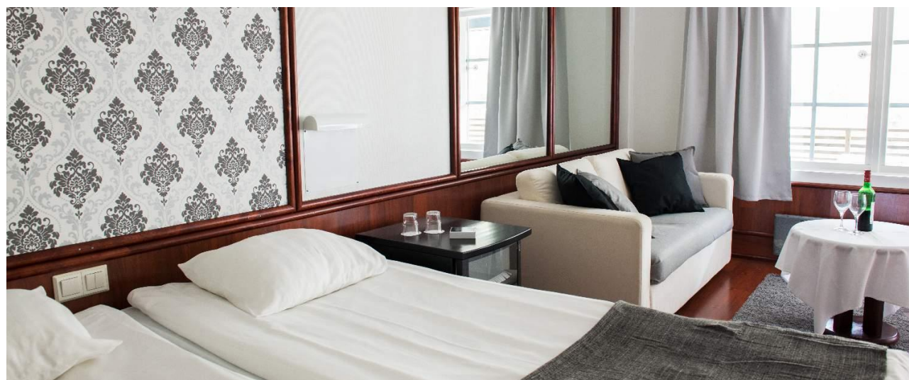
Chambre supérieure avec coin salon