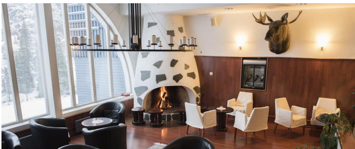
La salle « cheminée » de l'hôtel Royal Ruka