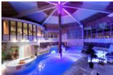
Centre Aqua Parc

L'hôtel a été rénové en 2018 et offre ainsi un mélange d'authenticité lapone et d'éléments modernes pour un bien-être global agréable. Le Holiday Club Hotel est également idéal pour les skieurs de fond et les amateurs de sports d'hiver. Situé au centre-ville, les pistes de ski de fond sont à quelques minutes à pied. L'hôtel se compose du bâtiment principal avec près de 140 chambres de 18 à 22 m 2 ainsi que des appartements attenants. Toutes les chambres sont équipées de lits jumeaux, toilettes/douche, radio, TV et WiFi. Cinq chambres supérieures avec leur propre sauna peuvent également être réservées. Outre le restaurant, le HolidayClub Hotel propose également trois bars ainsi qu'un centre moderne de Wellness avec une piscine pour une agréable détente après une journée en plein air.