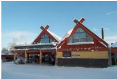
Entrée du restaurant

L'hôtel est situé au centre du petit village d'Äkäslompolo directement au bord des pistes de ski de fond. Les appartements que nous avons choisi comme hébergement sont très accueillants et tous équipés de salle de bains complètes avec leur propre sauna, coin salon, télévision, cuisine équipée avec chauffe-eau, téléphone et connexion Internet dans chaque appartement. La salle à manger pour les repas du soir et le petit déjeuner se situent dans le bâtiment principal et celui-ci est servi sous forme de grand buffet plein de spécialités lapones. Salle de fartage moderne à disposition.