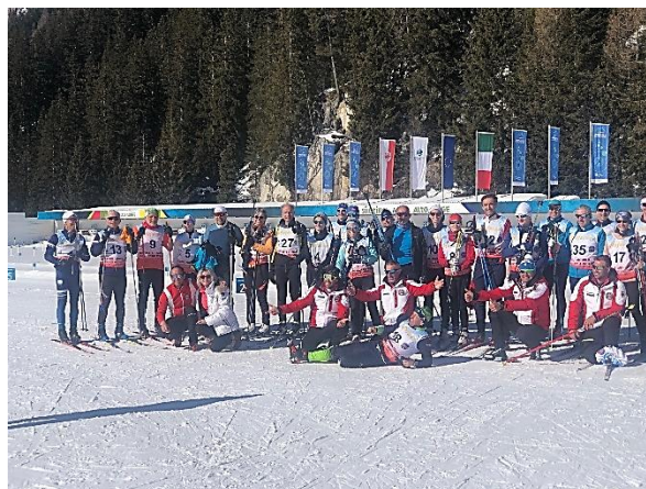
Ambiance assurée avec le Biathlon d'Anterselva !