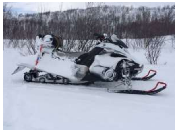
Motoslitte Yamaha Nytro 4 tempi o Lynkx X-trime 4 tempi