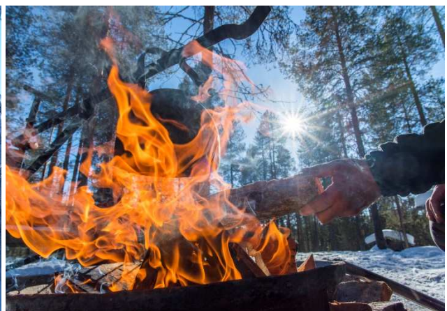
Motorschlitten-Abenteuer inklusive Lagerfeuer