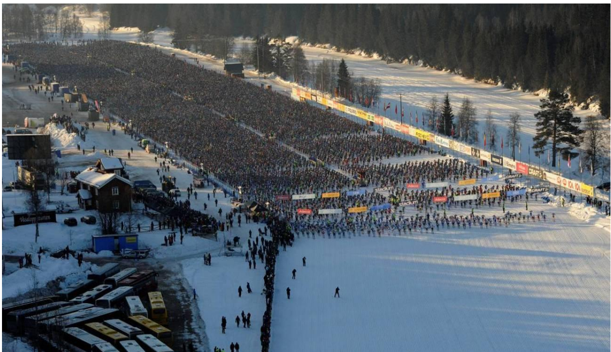
Départ de la Vasaloppet