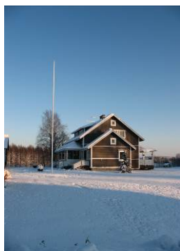
Nuits 1 et 2