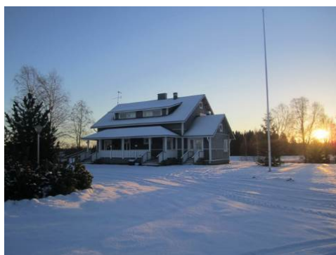
Nuits 3 et 4