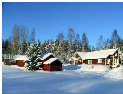
Nuits 5, 6 et 7